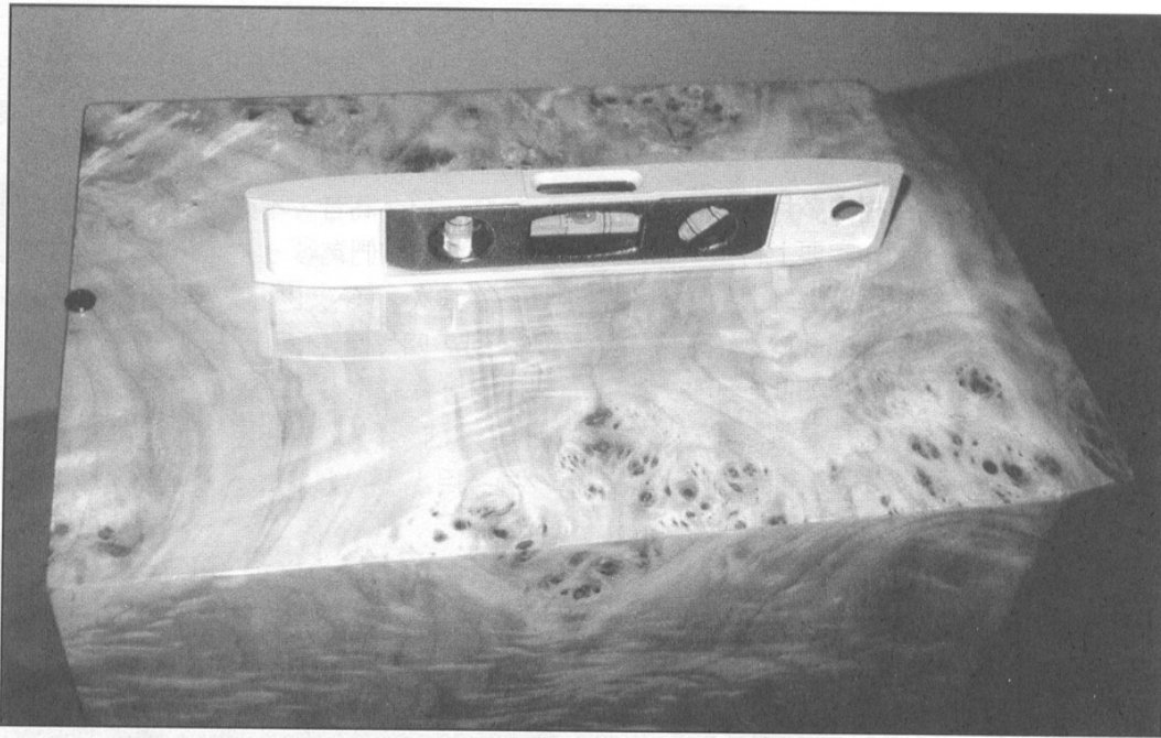
用水平呎 set 好 FS-888 是必須步驟，見到喇叭頂後邊沿黏一粒 Harmonix RF-57 嗎？能進一步精化音質，這是在寫完本篇才發覺的。