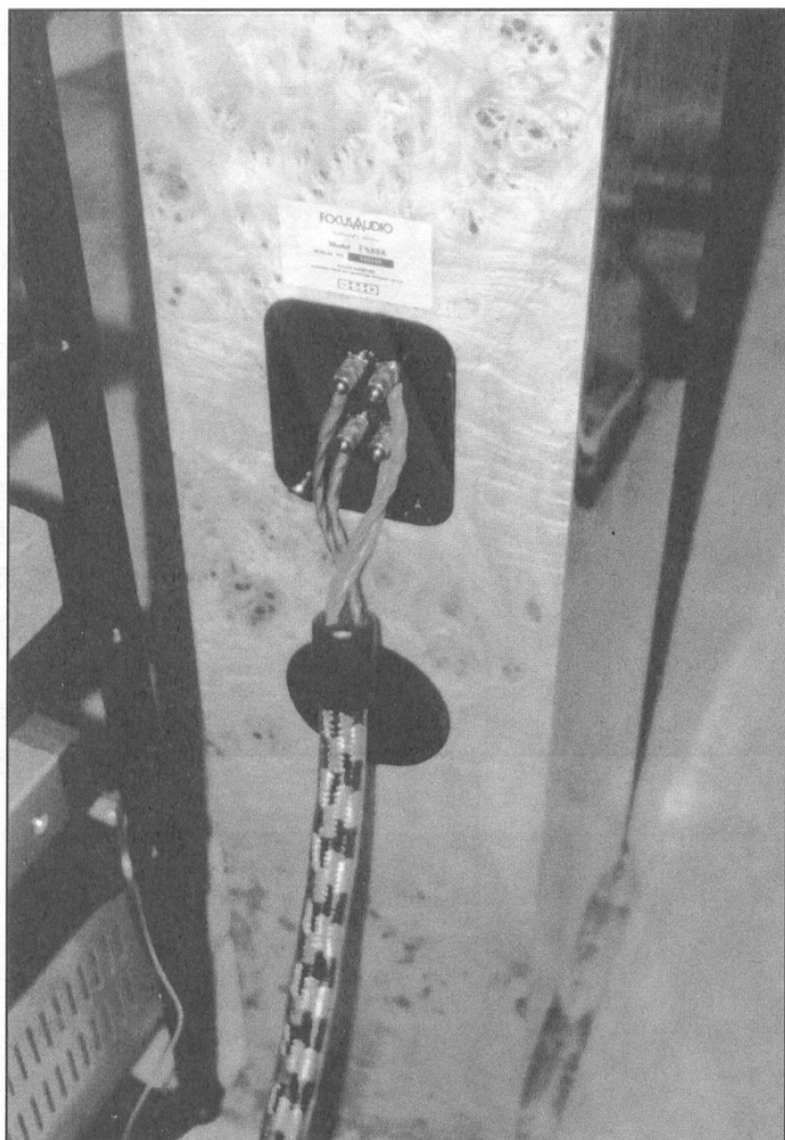
影音室用 Straight Wire 頂班 CRESCENDO 喇叭線 bi-wire 駁 FS-888。

背投。這裏的器材可不算太馬虎，計有音質極靚的EAD Theater Master Signature影院解碼前級，FAROUDJA Picture Plus DV1000 DVD兼CD機。聲甜音靚，力水充沛的300 watts x 5 Earthquake CINENOVA 功放，TARA LABS之Power Screen AD/10B 極品電源濾波器，Straight Wire頂班CRESCENDO bi-wire喇叭線，TARALABS The One訊號線等等……。噢！還