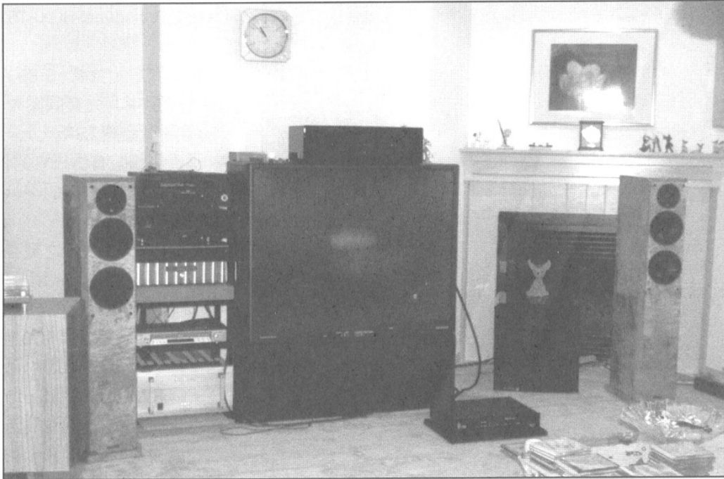
用 FS-888 欣賞電影係至豪華的享受。