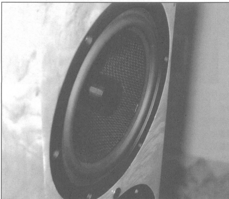
ETON Woofer 的 phase plug 近照。

人有精、氣、神，缺一不可。喇叭亦有三大元素，就是音箱，喇叭單元及分音器。人的健康缺乏什麼，自己馬上知道，但喇叭是死物，倘若收藏在內的分音器質素只屬平平，物主則未必會知道。市面非常多喇叭外表美輪美奐，甚至喇叭單元亦夠威儀，但若打開一看，分音器平庸者居多，接線更是不知所謂（普通塑料包皮，鍍了鎳的）。一般肯用 Solen 電容，空氣線圈的已經算