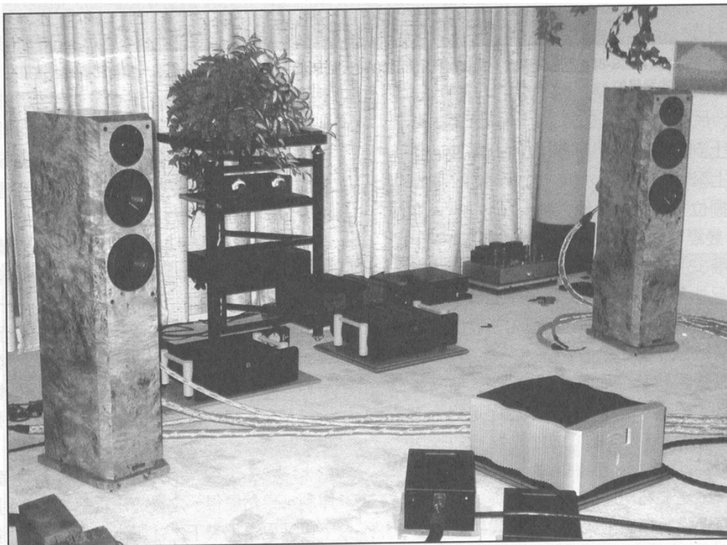
試音現場另一個角度看 FS-888，地下一對新 SIM AUDIO W6 單聲道功放，將會是另一套推動 FS-888 的大力（600 瓦）擴音機，請留意下期。