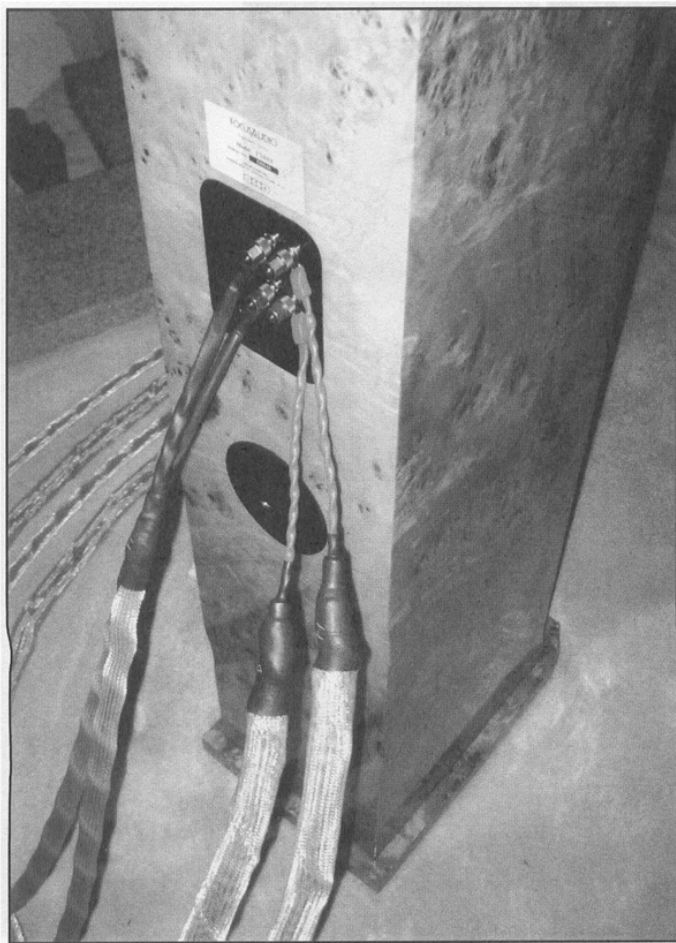
極品貴 NBS OMEGA bi-wire 侍候 FS-888。

那日我在Focus Audio房中逗留了整整一個多鐘，站在當時負責為《音響技術》報導CES大展立場而言，花費個多鐘絕對係個人Schedule的“Over Spending”，但也確實是「不能自己」，因我深被FS-888牢牢吸引住。雖然該示範房間狹窄（約12.5呎 x 18呎），致FS-888出中低頻動態有點「滿」